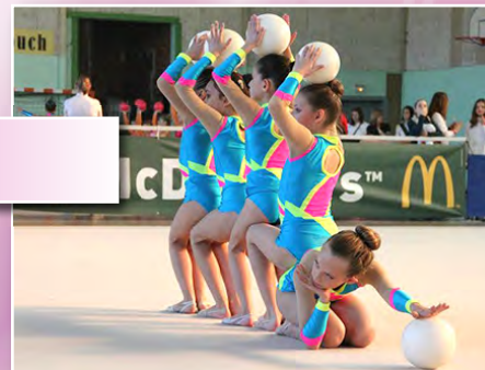
Les DC1 Benjamines se sont classés 1 ère