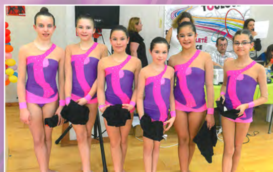
Les DC1 Minimes se sont classés 4 ème