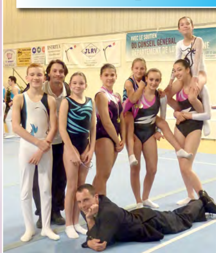
Une équipe au top mais l'entraîneur !..