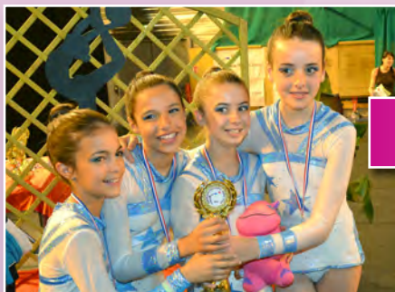
Les DC4 Minimes se sont classés 1 ère